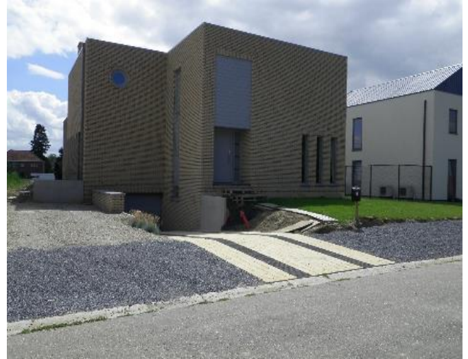
Foto 3 : (half)ondergrondse garage met afhellende inrit vanaf straat met drempel = voorbeeld van hoe het wel moet/kan.