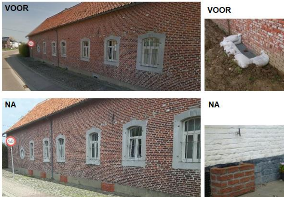
Figuur 3 : voorbeeld bescherming van openingen in de buitenmuren, verluchtingsgaten,.....