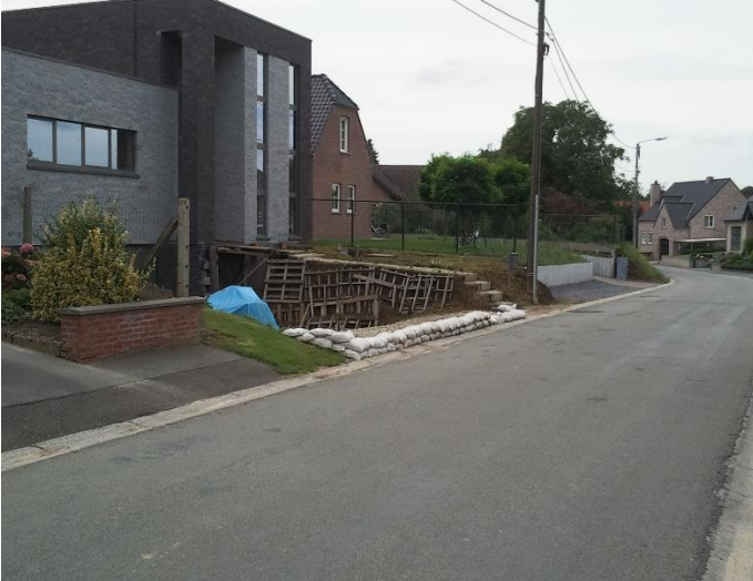
Foto 2 : (half)ondergrondse garage met afhellende inrit vanaf straat = voorbeeld van hoe het niet moet.

Stuur een berichtje naar info@land-en-water.be of neem telefonisch contact op met de Watering van Sint-Truiden (011/68.36.62).