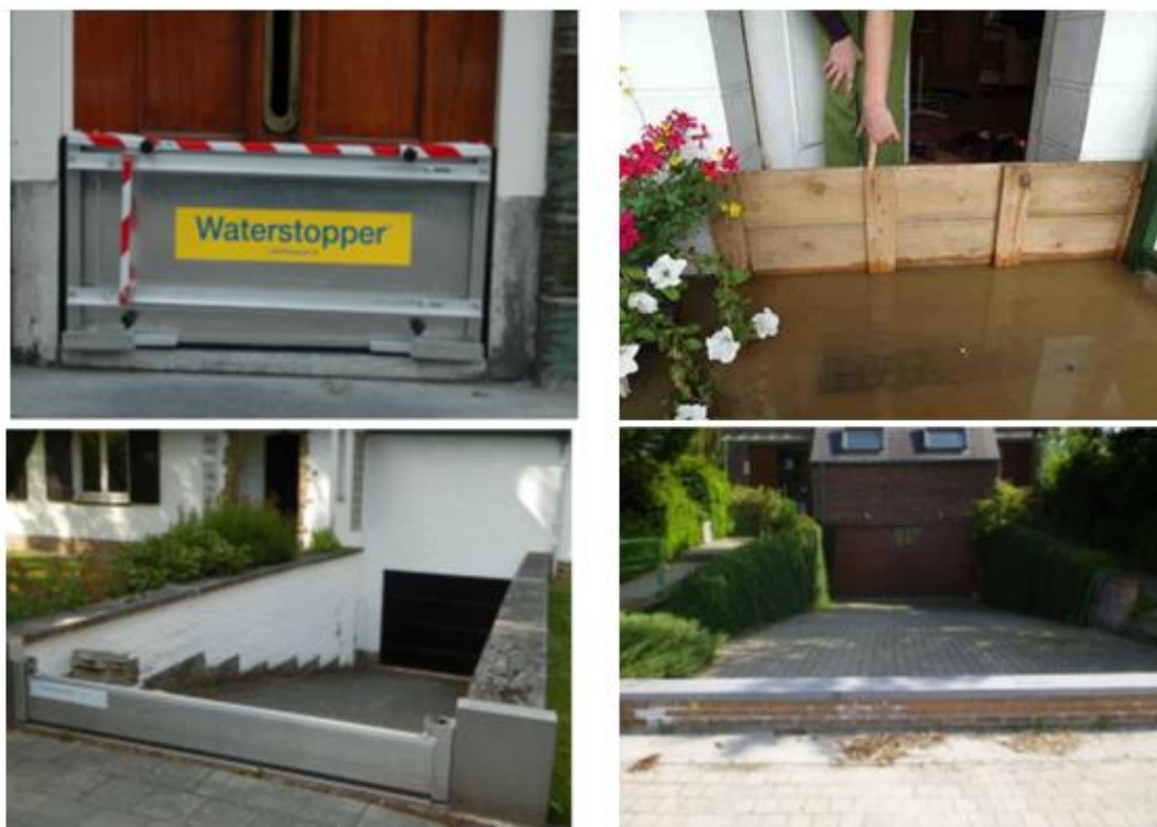
Figuur 4 : voorbeelden van (tijdelijke en permanente) afdichtingen